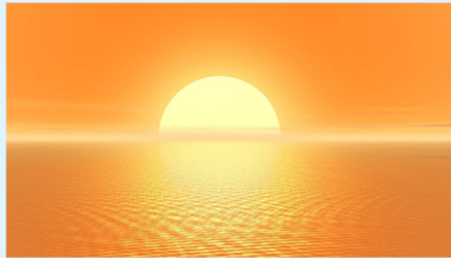
CONFERENCIA INFORMATIVA EN LA ASOCIACIÓN AVANCE