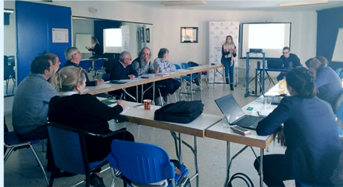
JORNADA INFORMATIVA SOBRE EMPLEO Y SALUD MENTAL

Conferencia Informativa dirigida a todas y todos los miembros de la Asociación Avance