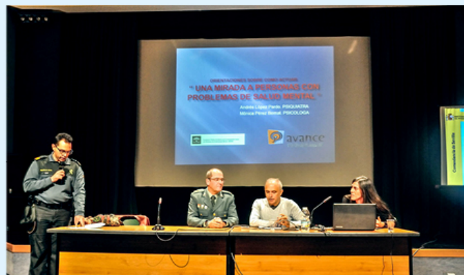
AVANCE PARTICIPA EN LAS JORNADAS DE SEGURIDAD CIUDADANA PARA FUERZAS Y CUERPOS DE SEGURIDAD