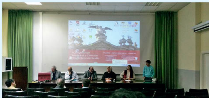
Jornada de Encuentro de Profesionales, Familiares y Personas Usuarias de los Servicios de Salud Mental