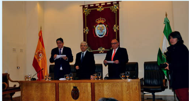
La Fundación Andrés Villacieros reparte Ayudas a Instituciones Benéficas Sevillanas y Becas a Estudiantes