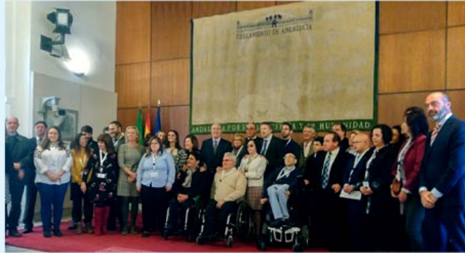
Lectura de manifiesto en el Parlamento de Andalucía con motivo del Día Internacional y Europeo de las Personas con Discapacidad